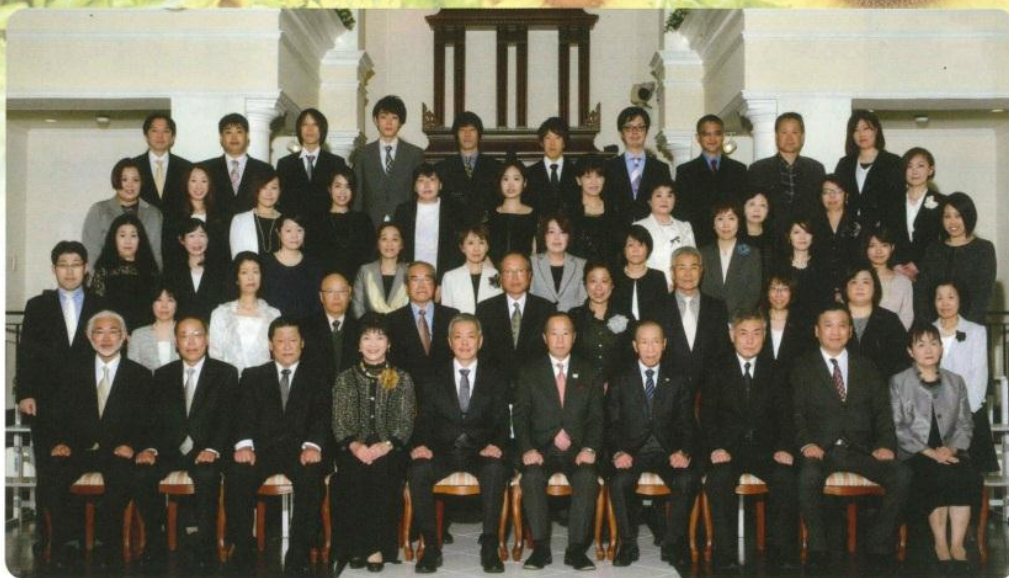
平成 30 年 4 月 11 日 社会福祉法人草雲会東寿苑 開設 30 周年記念

発行 社会福祉法人 草雲会 〒699-0108 島根県松江市東出雲町出雲郷 493 TEL (0852) 52-3330 FAX (0852) 52-5296