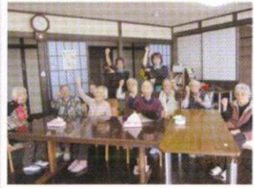
皆でソーラン・ソーラン