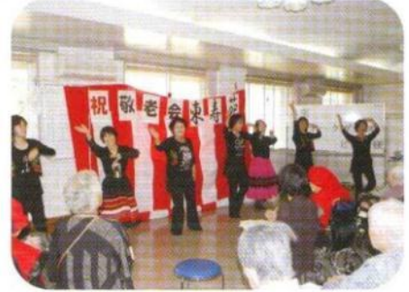
フォークダンス ピオニ様