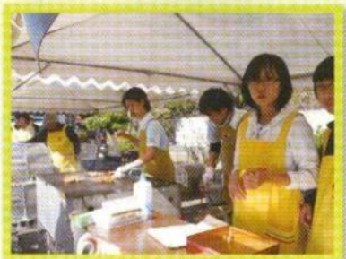
中学生ボランティアの皆さん大活躍♪

昨年の10月末に「～未来を地域の方とともに 感謝を込めて～」をテーマに東寿苑祭りを開催しました。肌寒い中ではありましたが、皆様のご協力をいただき無事に終えることができました。これも皆様のご支援、ご協力の賜物とお礼申し上げます。