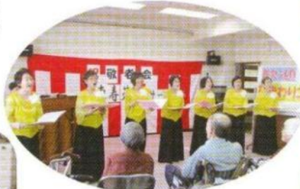
ひまわりコーラス様