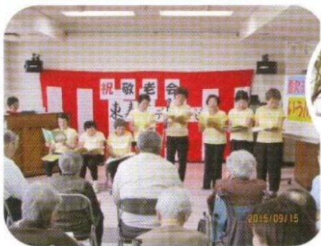
いう川コーラス様