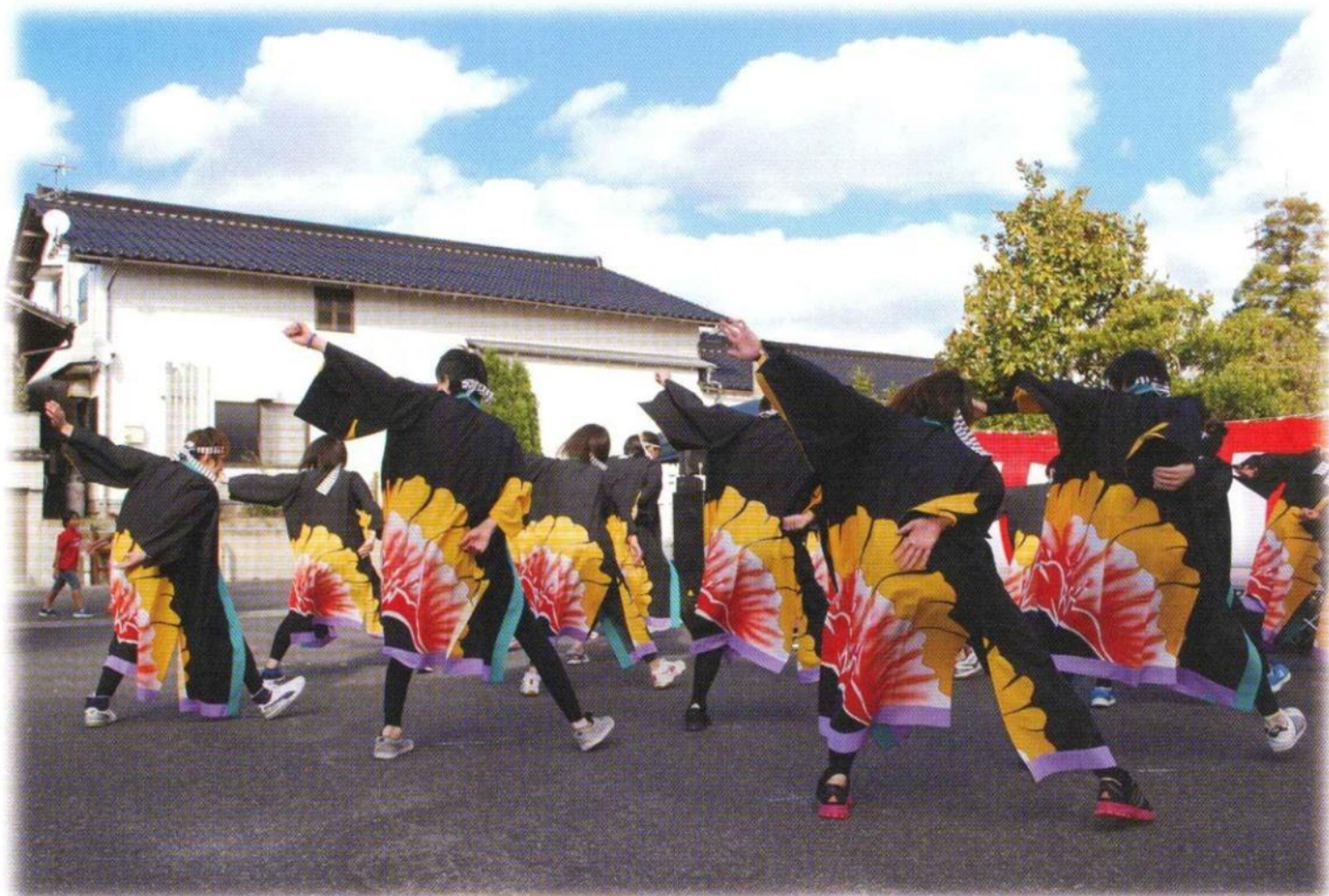
職員によるソーラン節（東寿苑祭り）

発行 社会福祉法人 草雲会 〒699-0108 島根県松江市東出雲町出雲郷493 TEL(0852)52-3330 FAX(0852)52-5296