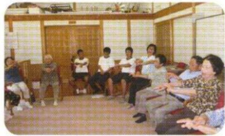
介護予防教室に中学生の職場体験参加