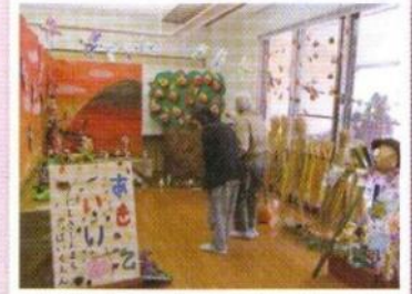
出雲郷公民館祭り見学