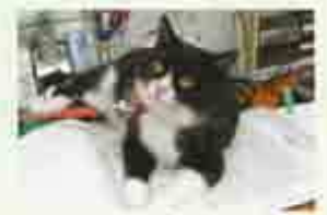
憩いの招き猫「福」も待っています

営業日：毎日（但し、1月1日～1月3日までを除く） 利用時間：営業日の9時30分～16時。その他居宅サービス計画に応じて対応します。 利用定員：30人（日曜日は19人） 営業区域：東出雲町内（町外の方もご相談に応じます） 利用料金：施設利用料とは別に食材料費などがかかります。詳しくはこちらまで、もしくは東寿苑ケアプラザセンターにご相談ください（☎52-6088）。 お問い合わせ先：☎52-4484（足立、寺脇） ご相談、見学等、お気軽にお電話ください。